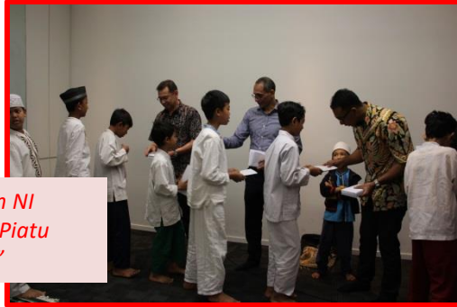
Buka Puasa Karyawan NI Bersama Anak Yatim Piatu "Dari Kita Untuk Kita"