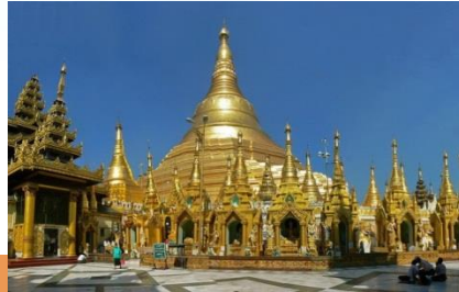
Pagoda Taman Alam Lumbini dan Pagoda Shwedagon

Jika kalian sedang berkunjung di Medan, maka patut berwisata di Tanah Karo, khususnya di Brastagi. Selain suasana yang dingin dan sejuk, Berastagi memiliki objek wisata yang tidak kalah menariknya dengan objek wisata lainnya yang ada di berastagi yaitu Taman Alam Lumbini. Taman Alam Lumbini kini menjadi sebuah destinasi wisata Berastagi yang populer, karena memiliki keunikan berupa adanya sebuah pagoda yang merupakan pagoda tertinggi di Indonesia, dengan warna mencolok yang menarik perhatian, seperti pagoda Shwedagon di Myanmar. Dibuka pada Oktober 2010 replika ini pernah dicatitkan pada rekor MURI untuk kategori stupa tertinggi di Indonesia, serta termasuk sebagai replika tertinggi nomor dua di Asia Tenggara.