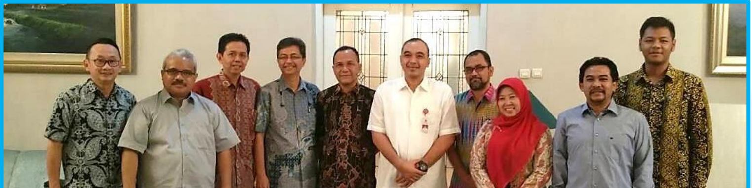
(Management PDAM TKR, Management TKCM, Bupati Tangerang dan Satuan Kerja terkait Pemkab Tangerang)

Dengan adanya kesepakatan perjanjian perpanjangan konsesi tersebut, TKCM dapat tetap beroperasi dengan persyaratan untuk melakukan investasi tambahan berupa capacity up-rating/peningkatan kapasitas sebesar 300 Liter/detik. Hingga saat ini, kapasitas WTP TKCM baru mencapai 1,275 L/dtk. Dengan demikian, diharapkan pada akhir tahun 2018 total 1,575 L/dtk dapat dialirkan ke PDAM TKR yang kemudian disalurkan untuk memenuhi kebutuhan air minum perkotaan seperti rumah tangga, komersial dan industri di Kabupaten Tangerang, Kota Tangerang, serta DKI Jakarta.