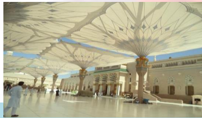
Masjid Agung Jawa Tengah, Semarang vs Masjid Nabawi, Arab Saudi

Masjid Agung Jawa Tengah terletak di Semarang. Masjid ini diresmikan pada tahun 2006 oleh Presiden SBY. Hal yang membuat mencolok dari bangunan masjid adalah pelatarannya yang mirip dengan Masjid Nabawi di Madinah. Dimana terdapat beberapa payung yang akan terbuka dikala shalat Jumat .