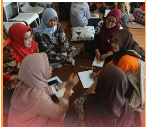
Kampus Guru Cikal N Jakarta, 25.26.27 Oktober 2019