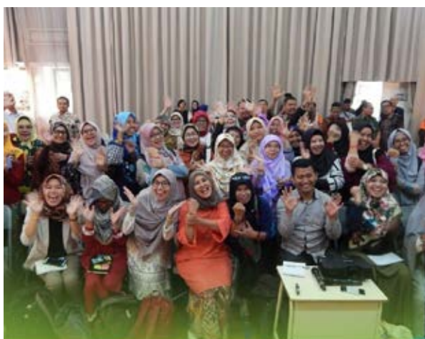
Kampus Guru Cikal N Jakarta, 25.26.27 Oktober 2019