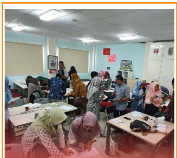
Kampus Guru Cikal N Jakarta, 25.26.27 Oktober 2019

Nusantara Care bekerja sama dengan Kampus Guru Cikal mengadakan acara bertajuk Temu Pendidik Nusantara 2019. Acara tahunan yang dilaksanakan pada tanggal 25 – 27 Oktober 2019 ini dihadiri oleh kurang lebih 1.000 guru dari 145 daerah di Indonesia. Kegiatan ini merupakan forum pertemuan para guru untuk saling bertukar pikiran dan pengalaman ketika mengemban tugas dalam bidang pendidikan. Kontribusi Perusahaan dalam acara ini merupakan wujud kepedulian Perusahaan di bidang pendidikan untuk mendukung terciptanya para pengajar yang profesional.